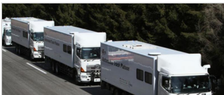
【コネクテッド インダストリーズ vol.2】自動運転で人、クルマ、社会の関係はどう変わる？