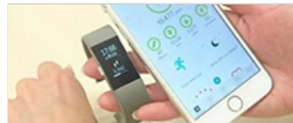
【コネクテッド インダストリーズ vol.4】ヘルスケア・バイオ産業へのインパクト